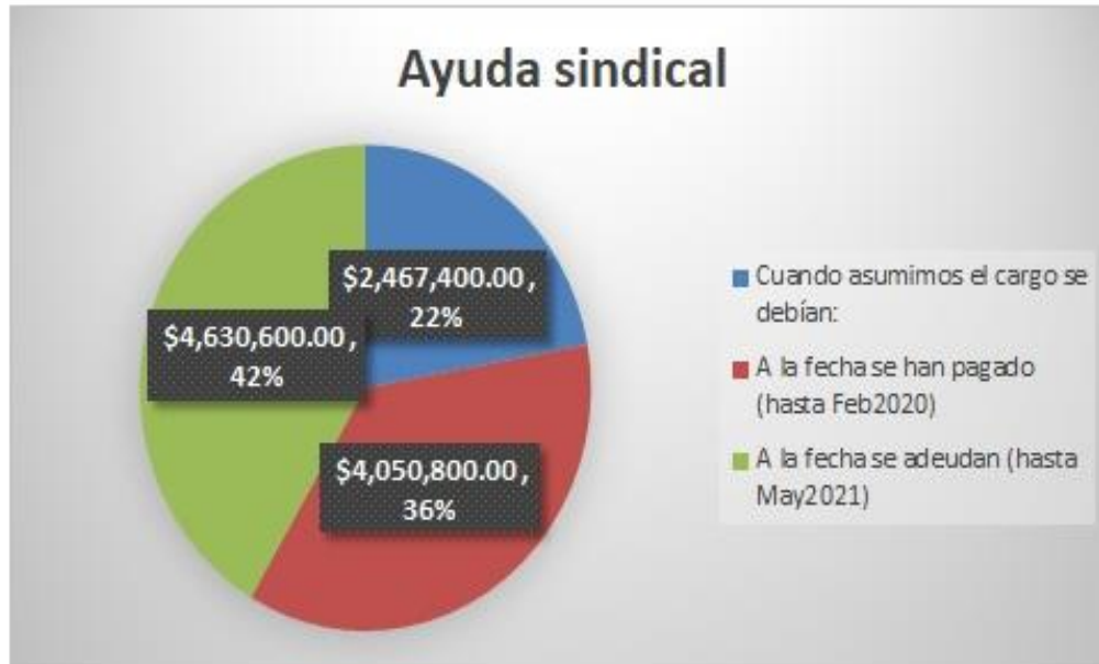
Figura 1. Informe de prestaciones. Parte 1.